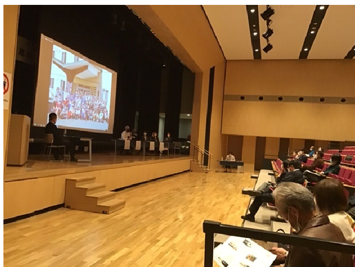
恵庭×養生メソッド

学校祭での鍼灸治療や、無料治療体験は、地域住民や本学卒業生の参加も多く盛況である。特に学校祭における地域商店の出店等もあり、学校の施設を活用した社会貢献・地域貢献をしていると考えている。また10月には恵庭市、北海道文教大学と共催して「恵庭×養生メソッド」を開催し、東洋医学の養生の考えについて普及・啓発を行っている。2023年4月には学校近隣のレストランで「養生メソッド×Cafe&Trattoria Polaris 春 spring」に学生を動員している。また本校臨床センター主催の地域住民に対する公開講座も積極的に行っていく予定であり、地域住民から愛される学校を目指す。