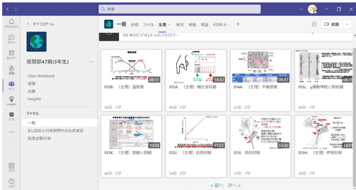
図1 オンデマンド動画